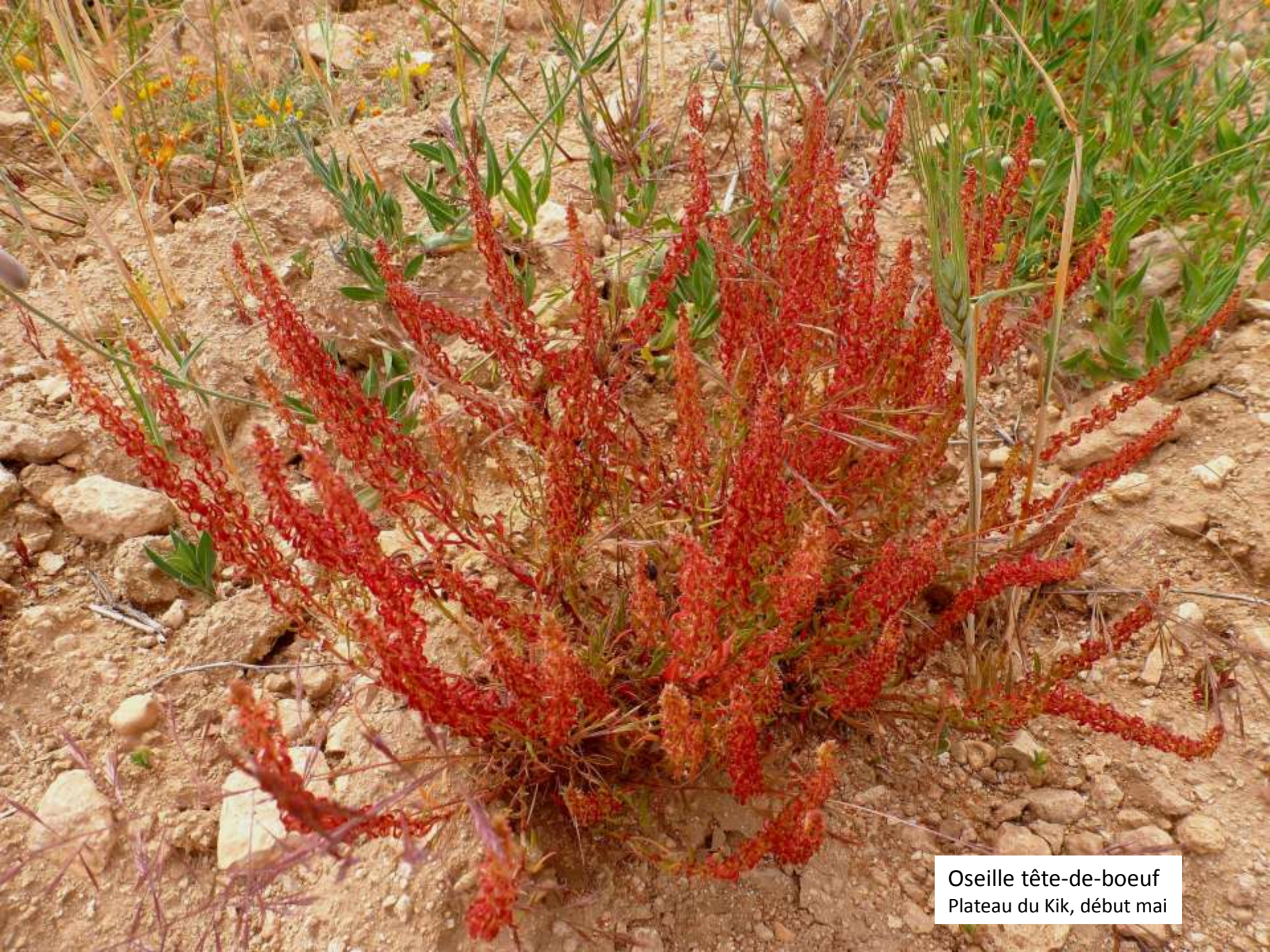
Oseille tête-de-boeuf Plateau du Kik, début mai