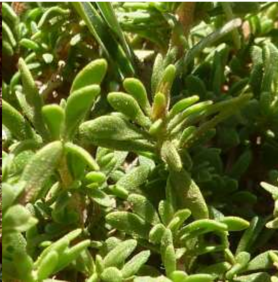
Feuilles de thym fausse sarriette : Glandes à huiles essentielles

Le thym (comme la lavande) résiste à la chaleur et à la sécheresse du climat méditerranéen, en limitant la transpiration des feuilles : -petites feuilles, -marges retournées vers le bas , -glandes aromatiques (qui produiront les huiles essentielles) -Feuilles ( et tiges) poilues.