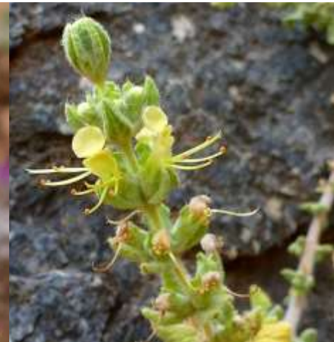
Germandrée de Demnate (corolle à tube renversé)