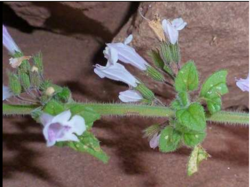
Calament faux népéta « menta »