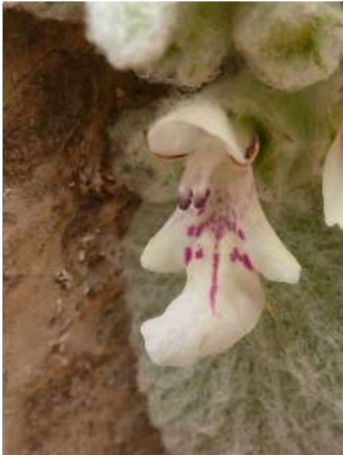
Épiaire des rochers