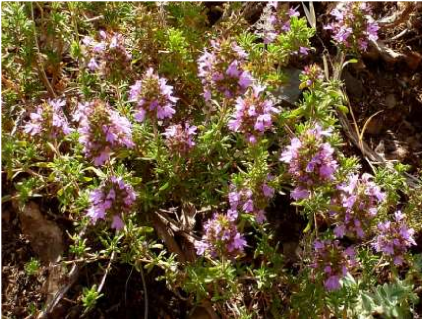
Thym fausse sarriette