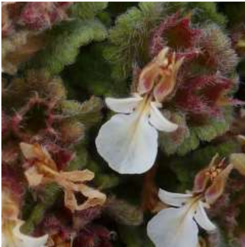
Germandrée à feuilles rondes