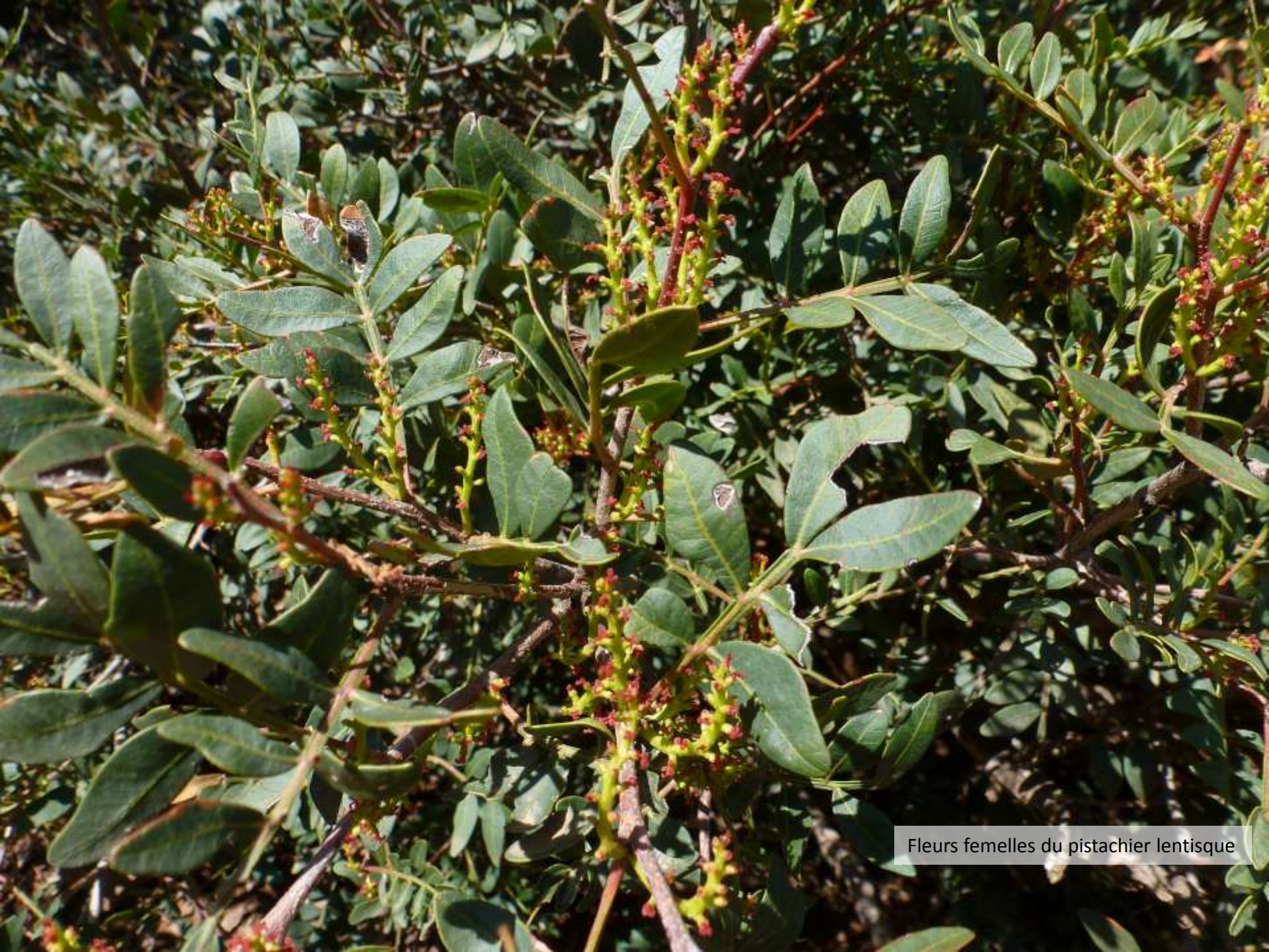
Fleurs femelles du pistachier lentisque