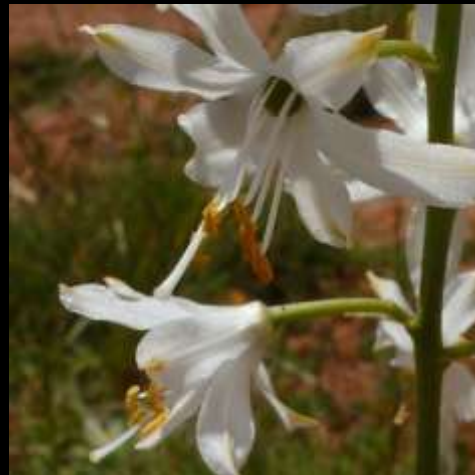
Phalangère à fleurs de lis