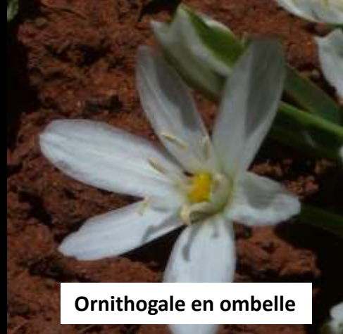
Ornithogale en ombelle