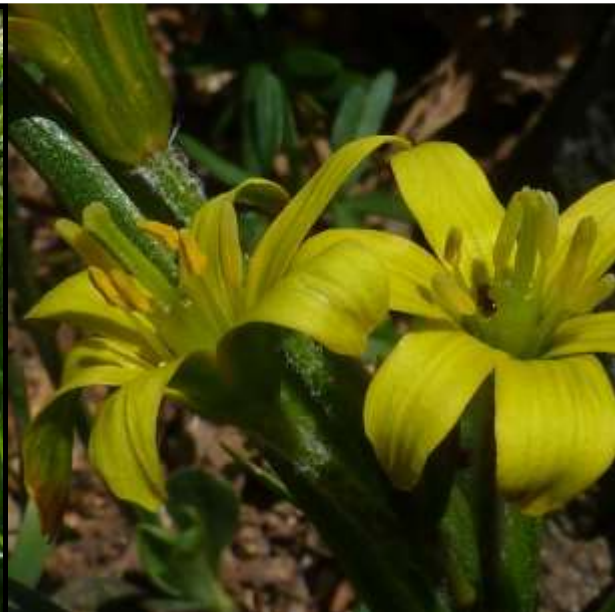
gagée de Liotard