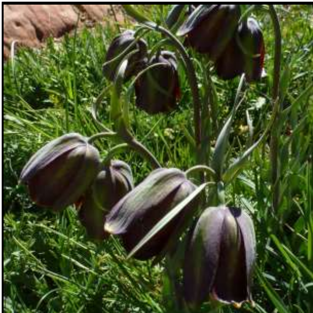
Fritillaire de l'Atlas