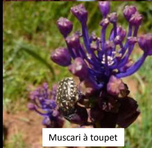
Muscari à toupet