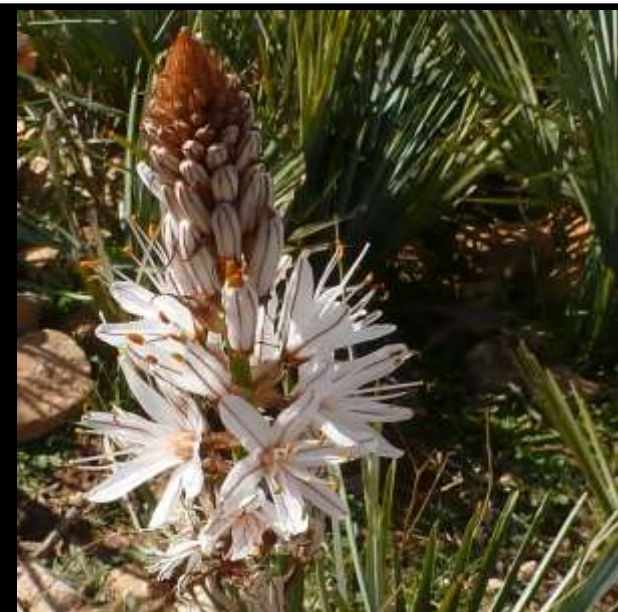
Asphodèle à petits fruits