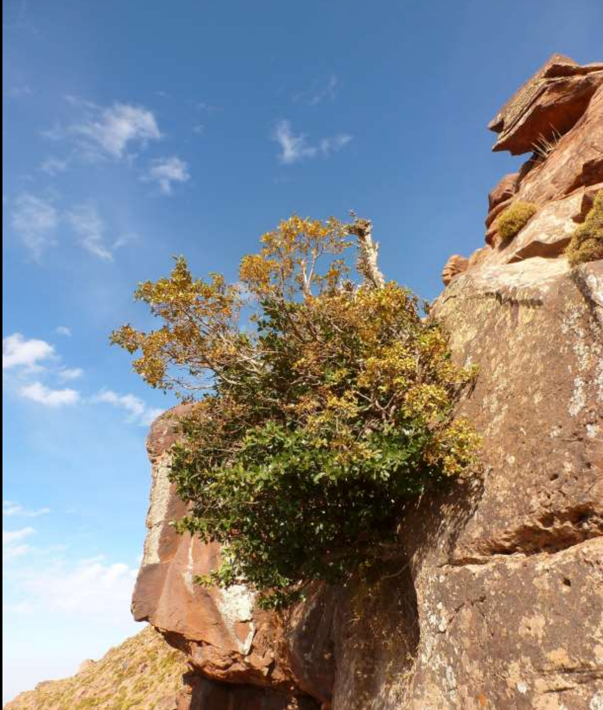
Houx et Amélanhier (tizrag, octobre)