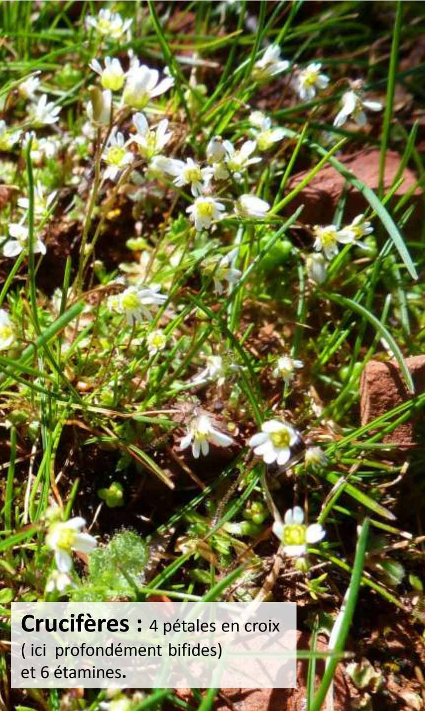
Crucifères : 4 pétales en croix ( ici profondément bifides) et 6 étamines.