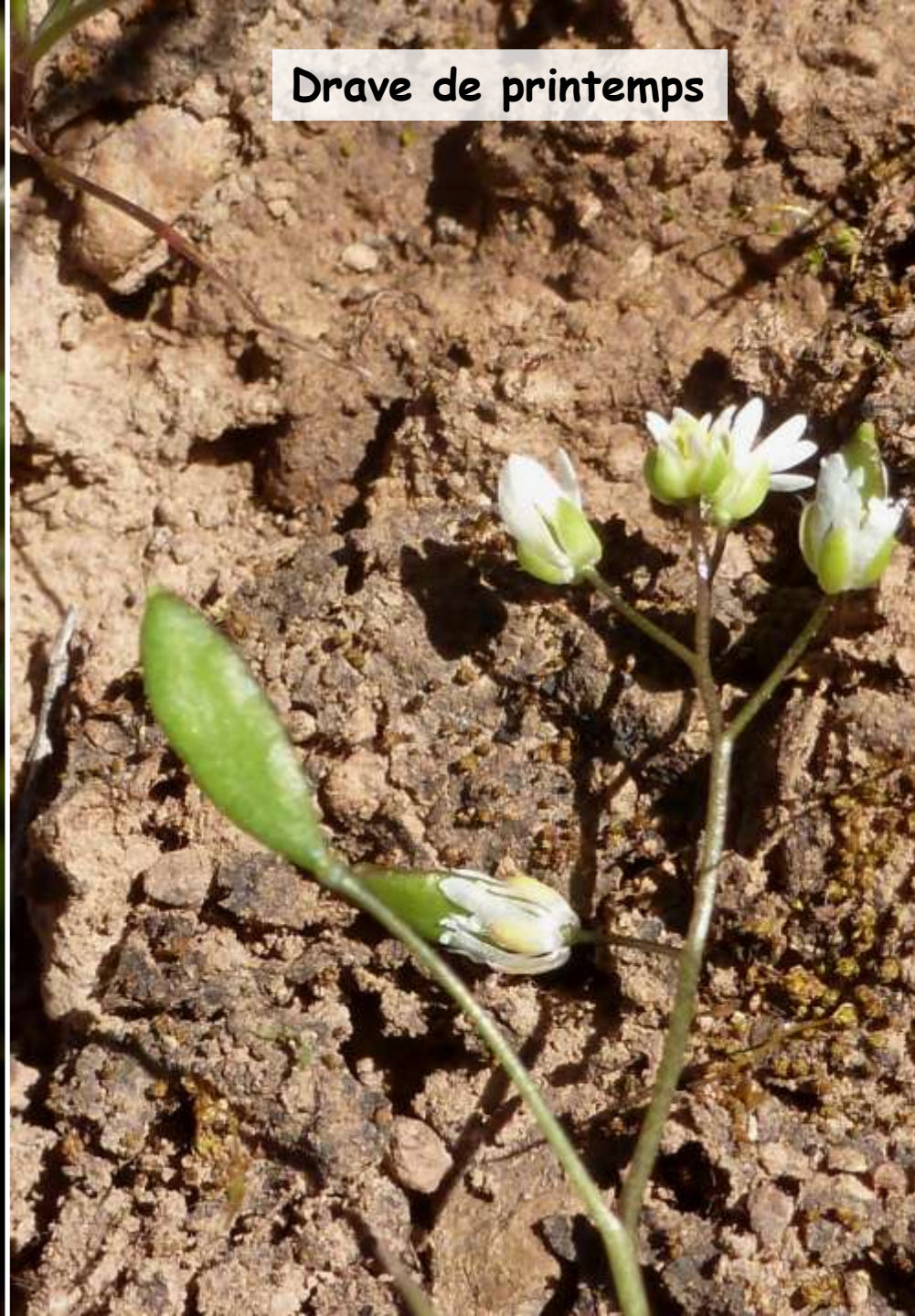
Drave de printemps