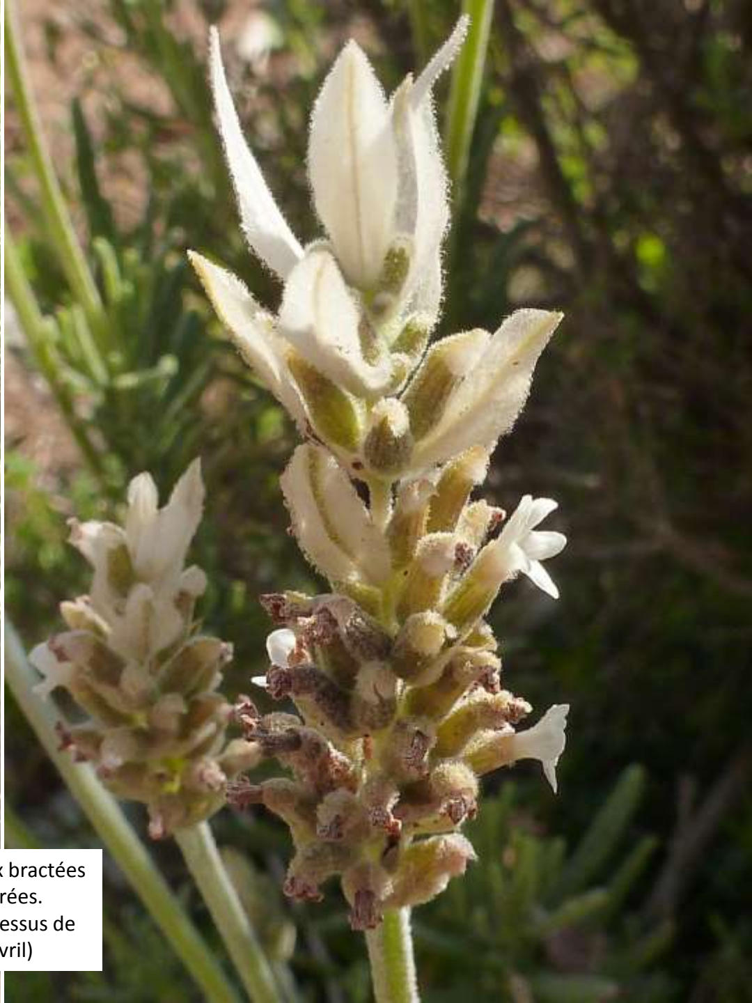
Lavande dentée aux bractées bizarrement décolorées. Rare. ( maquis au-dessus de Assif Wadaker, fin avril)