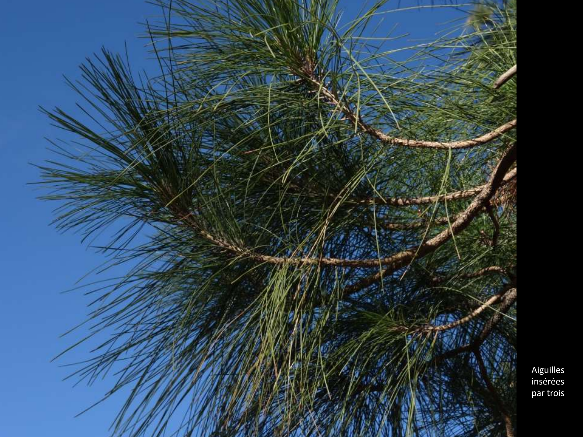
Aiguilles insérées par trois