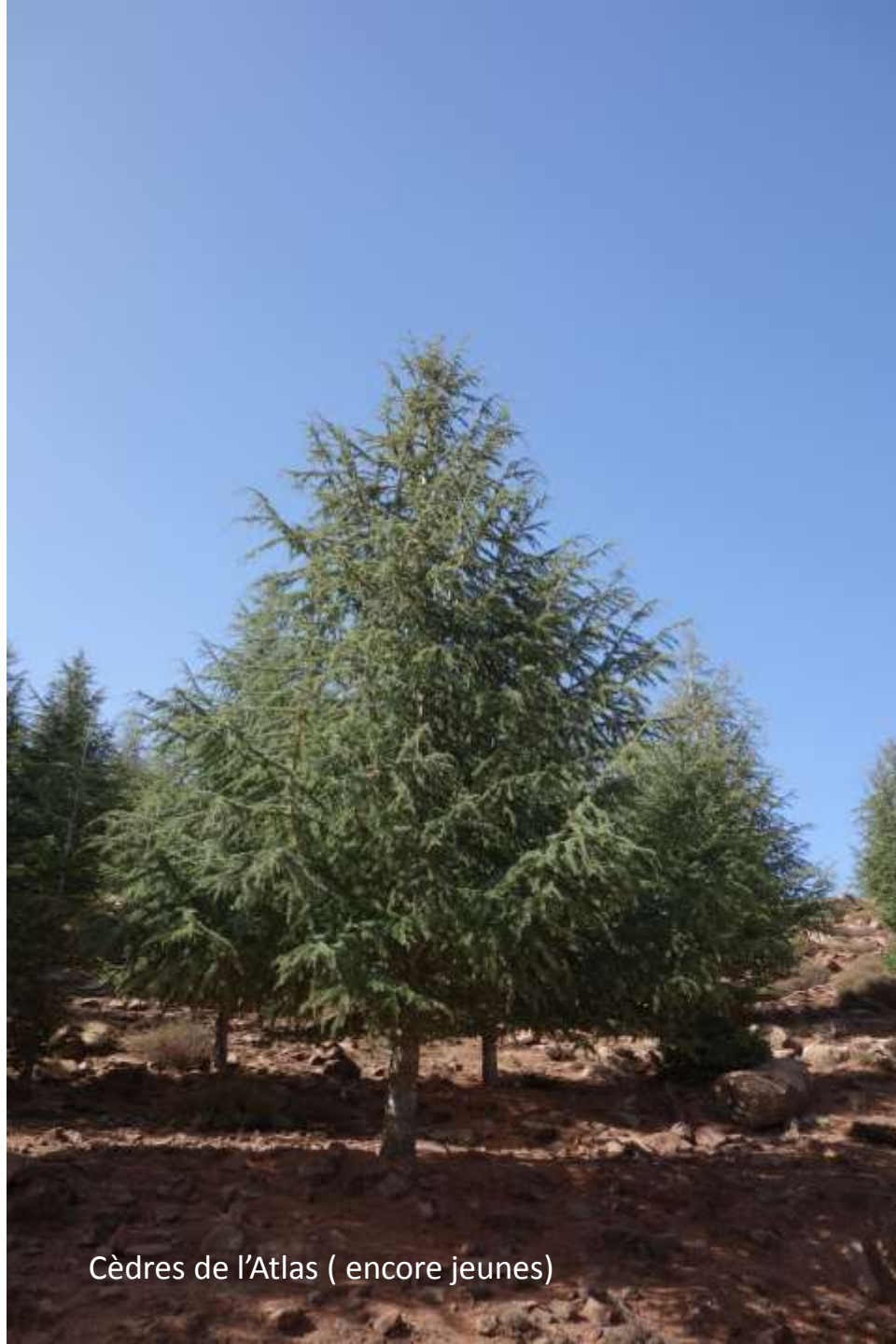
Cèdres de l'Atlas ( encore jeunes)