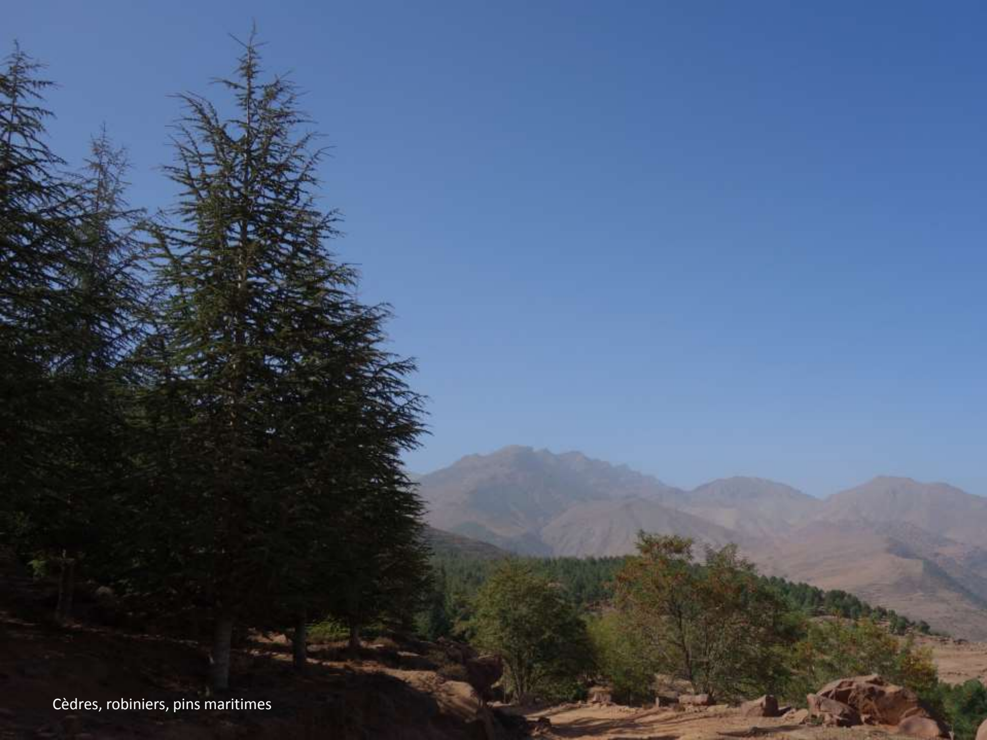
Cèdres, robiniers, pins maritimes