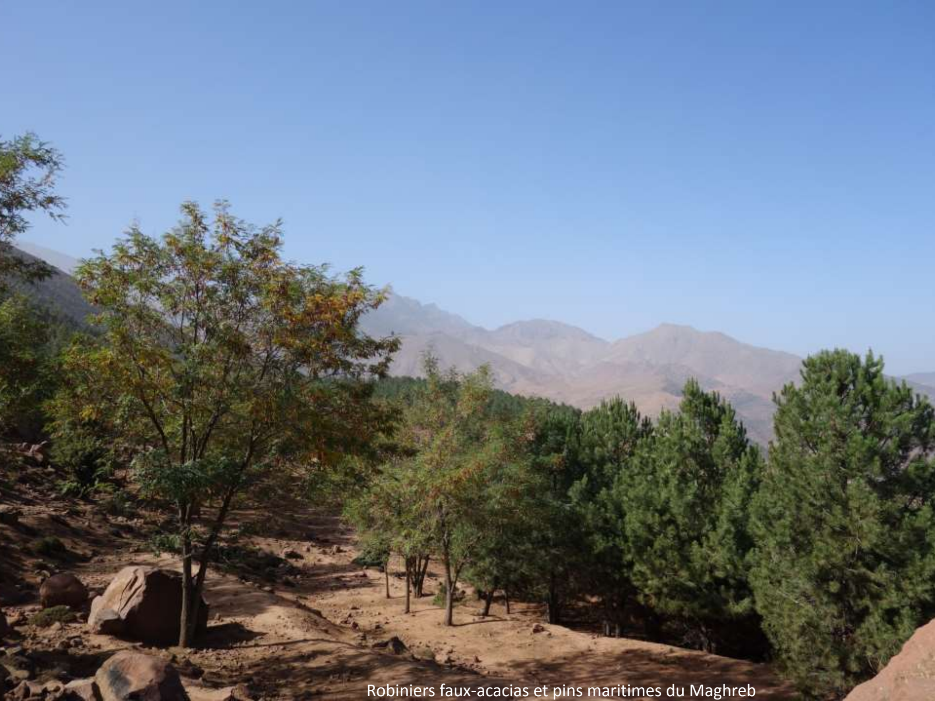
Robiniers faux-acacias et pins maritimes du Maghreb