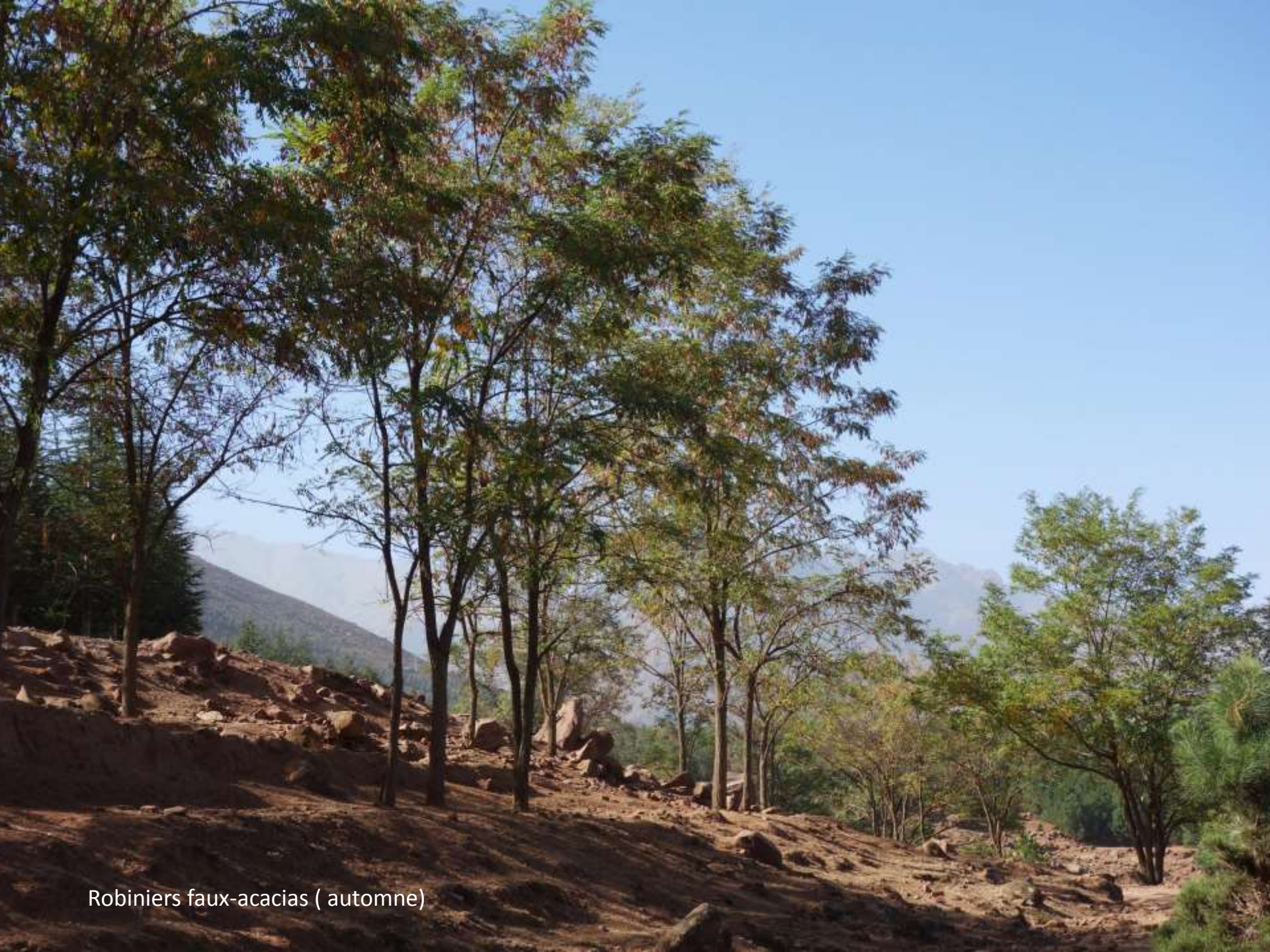
Robiniers faux-acacias ( automne)