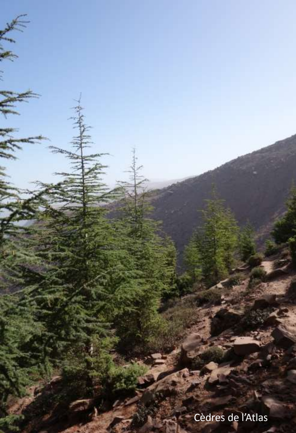
Cèdres de l'Atlas