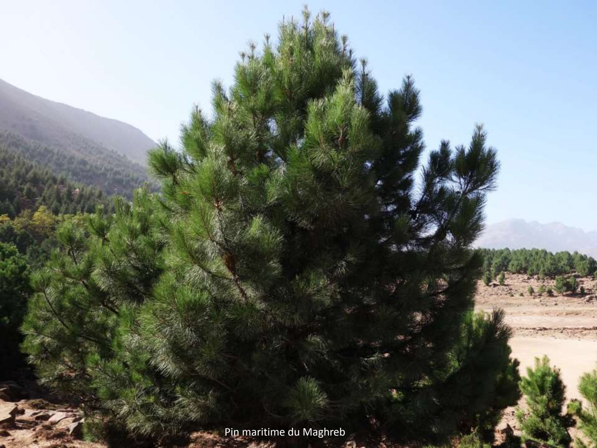
Pin maritime du Maghreb