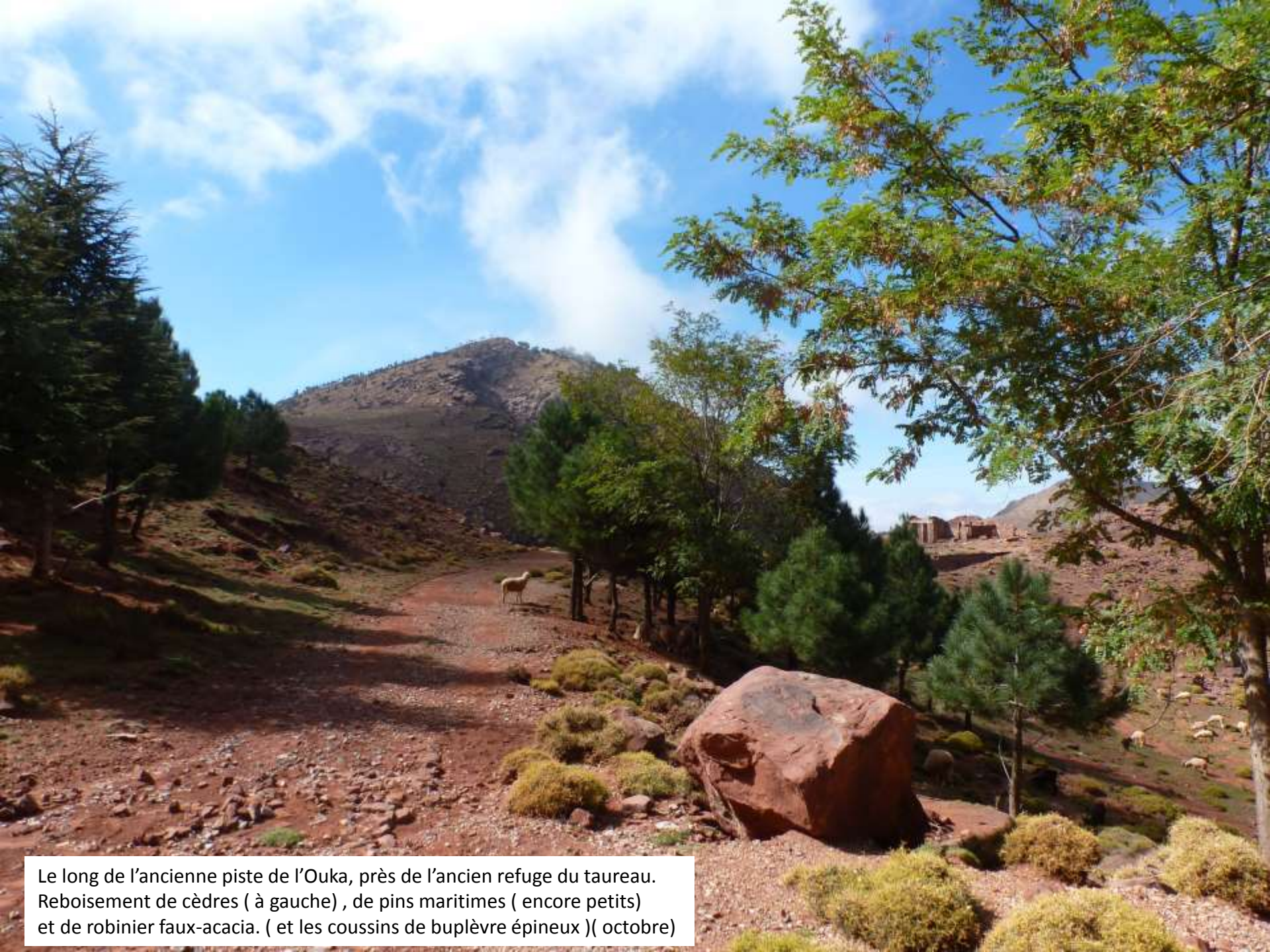
Le long de l'ancienne piste de l'Ouka, près de l'ancien refuge du taureau. Reboisement de cèdres ( à gauche ) , de pins maritimes ( encore petits ) et de robinier faux-acacia. ( et les coussins de buplèvre épineux )( octobre)