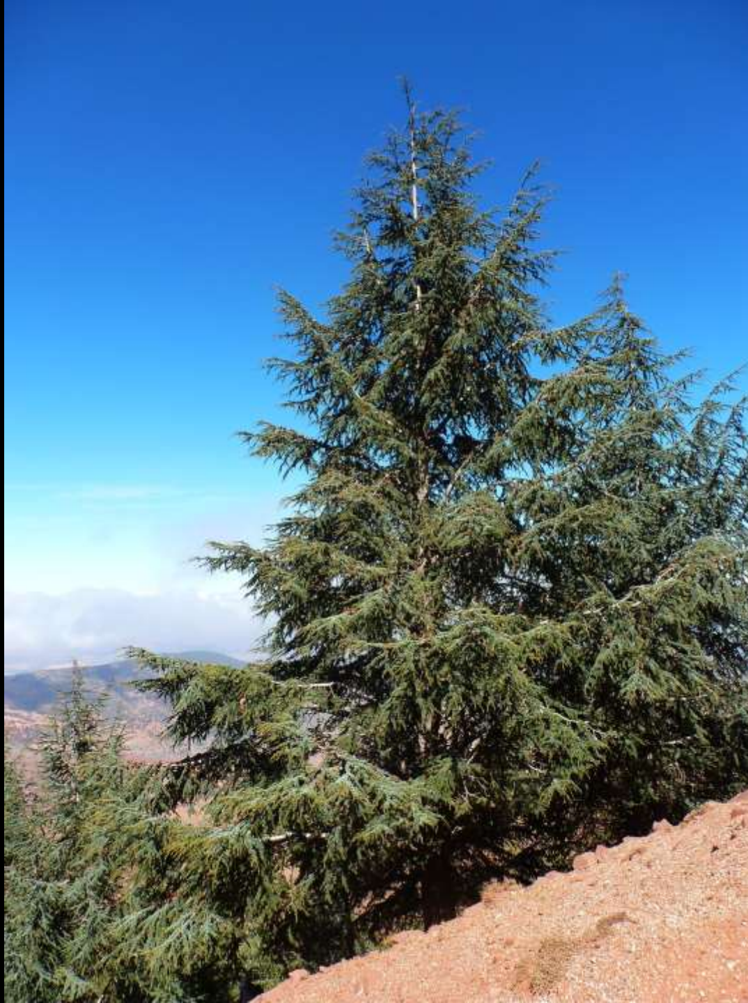
Cèdre de l'Atlas Reboisement sous la falaise du Tizrag, le long de l'ancienne piste de l'Ouka. Associé au pin maritime et au robinier faux-acacia. Octobre.