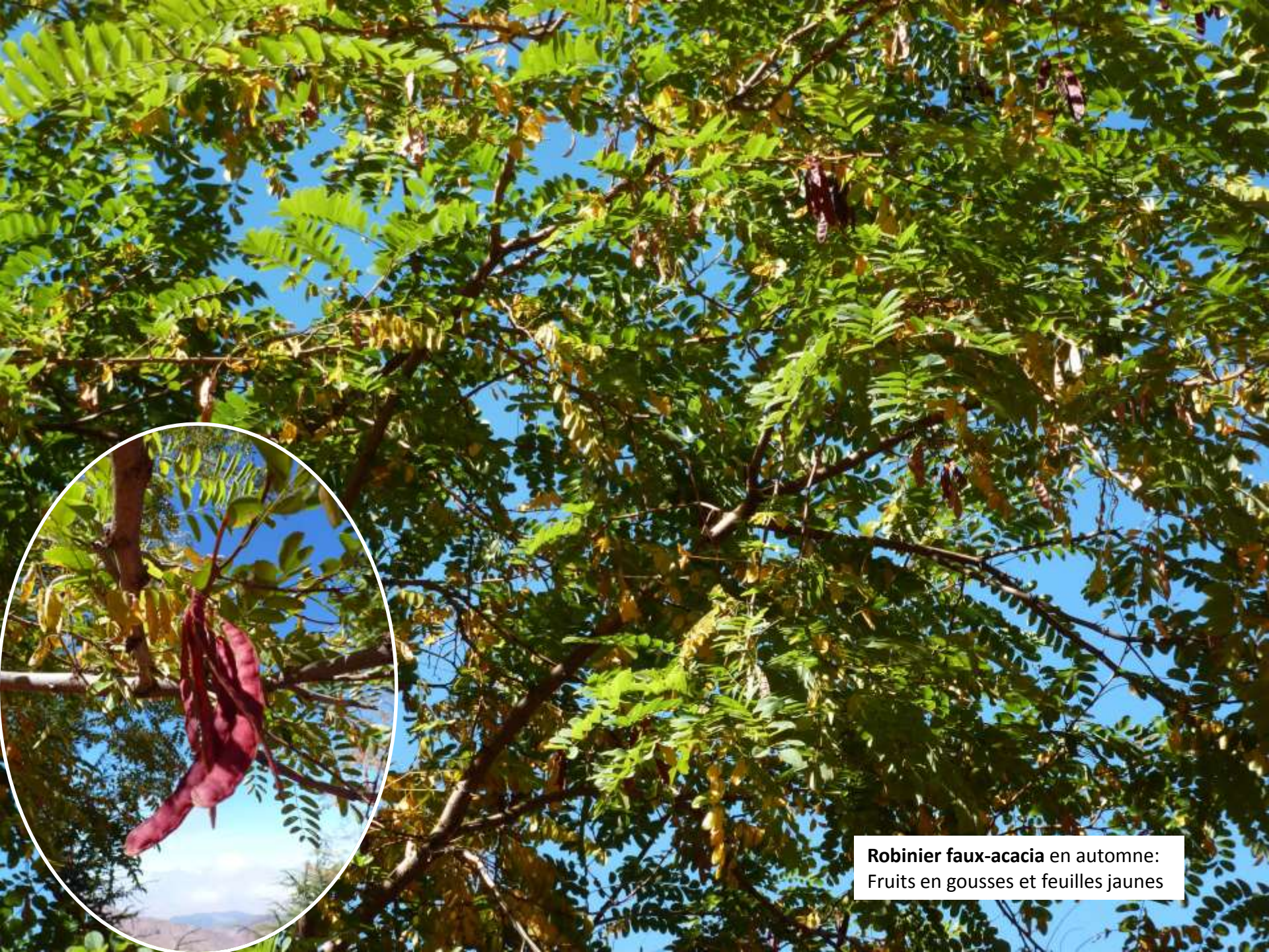
Robinier faux-acacia en automne: Fruits en gousses et feuilles jaunes