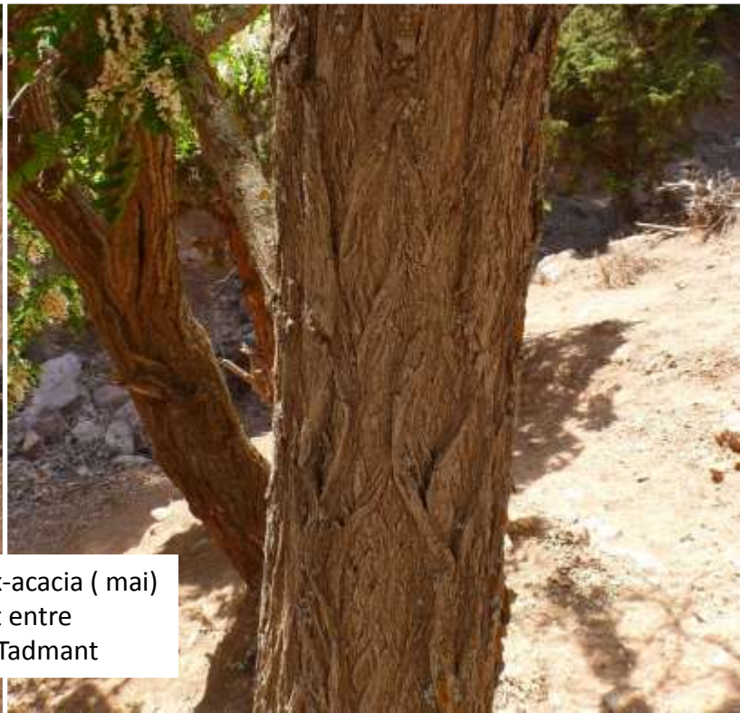
Robinier faux-acacia ( mai) Reboisement entre Agaïouar et Tadmant